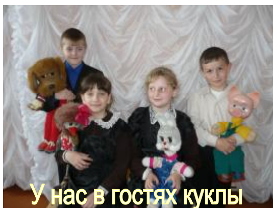
У нас в гостях куклы