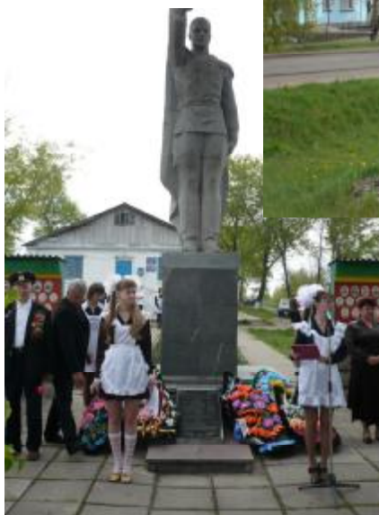
Памяти павших будем достойны