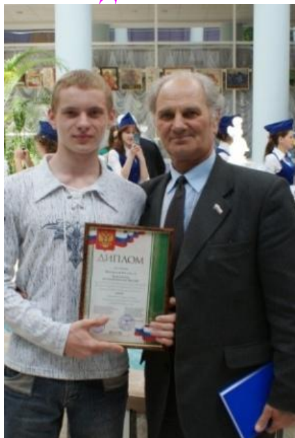
Производственная бригада Шелаевской школы - призер областного конкурса