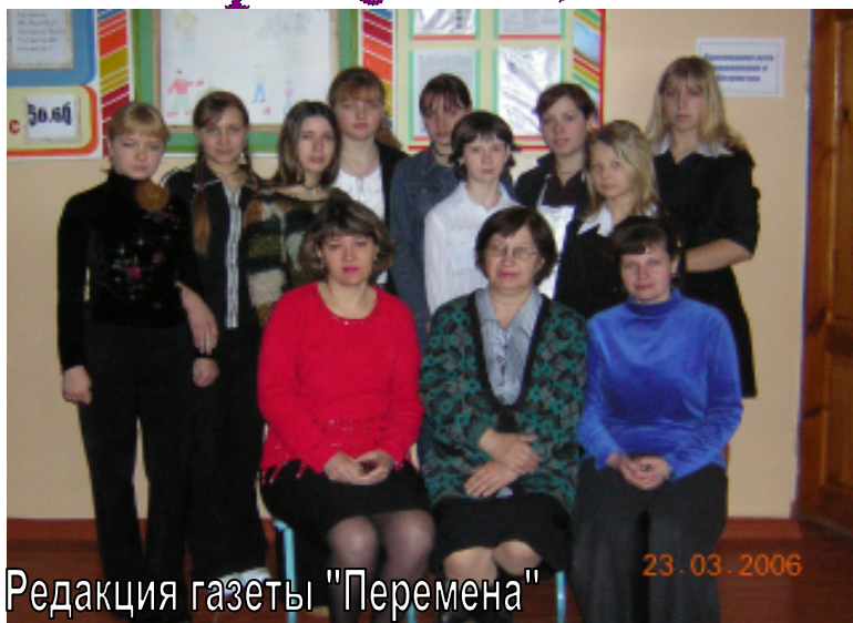
Редакция газеты "Перемена"