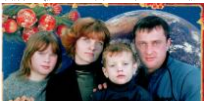
Так держать, земляки!